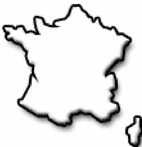
Carte des contours de la France