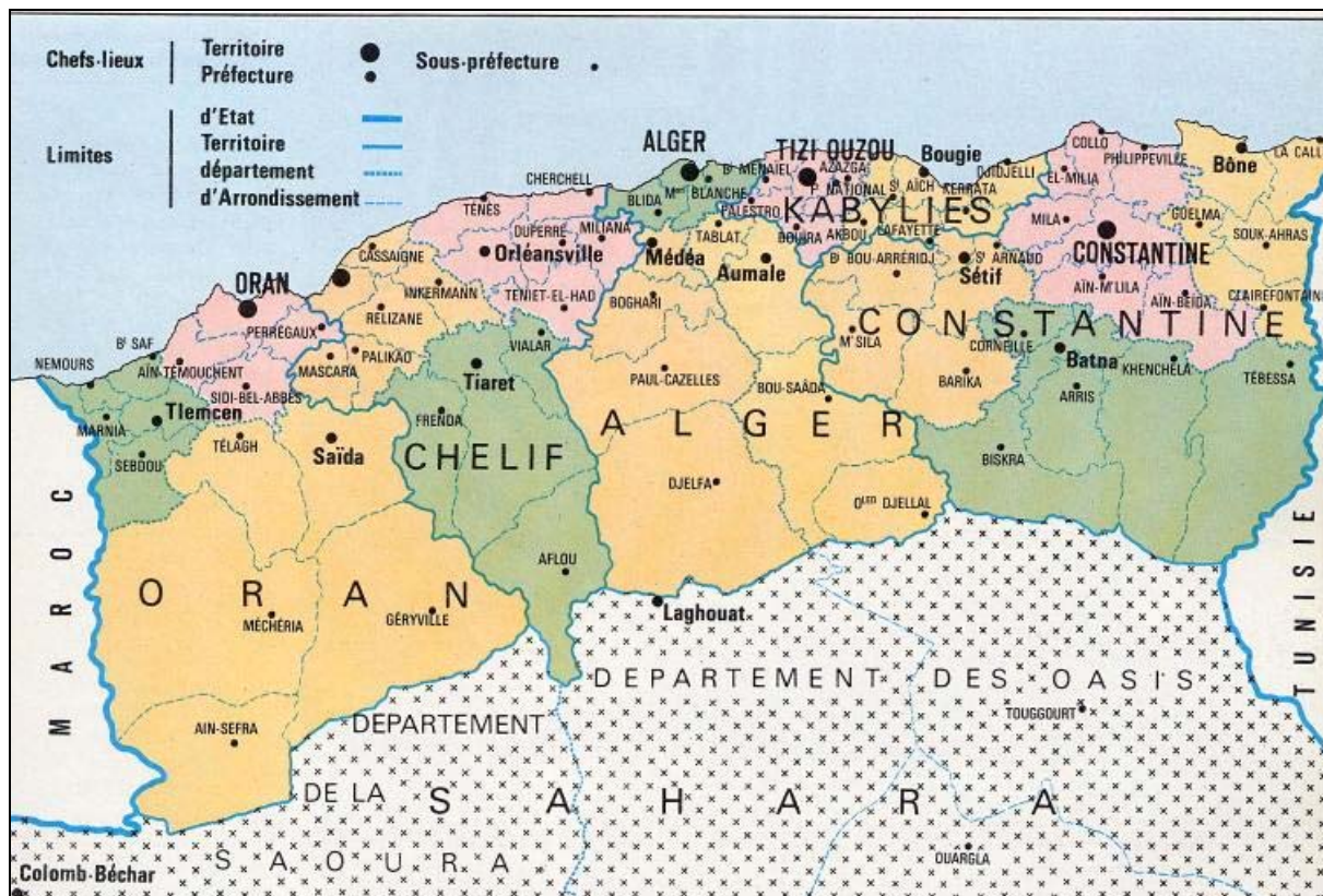
Carte des anciens départements de l'Algérie française (visible sur plusieurs sites web).

1962- Après l'indépendance de l'Algérie en 1962, les 15 départements (9A-9R, 8A, 8B) ont perduré jusqu'en 1978. L'Algérie indépendante conservera plusieurs années le découpage administratif réalisé par la France. Les codes des départements français ont été utilisés jusqu'en 1964.